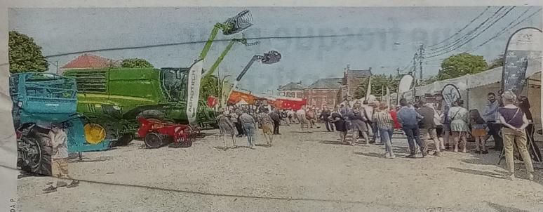
Pas de foire agricole sans «grosses machines» évidemment.