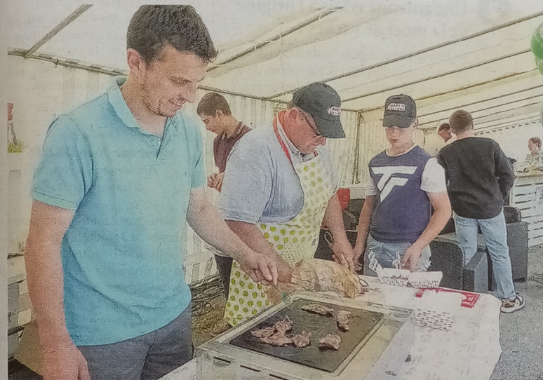
Au stand FDSEA, la section bovine faisait déguster la viande locale.

Tailler le bout de gras, se réunir autour de frites locales et d'un verre, partager autour de l'agriculture : la foire agricole d'Abbeville a permis à tous de se retrouver. Retour en images.