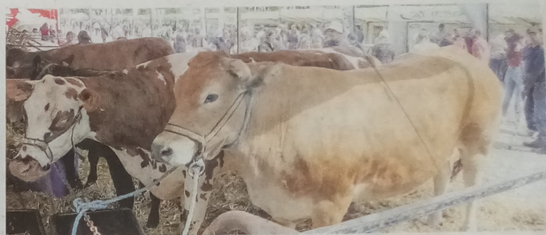
Pas de concours bovin cette année, mais les animaux étaient de sortie.