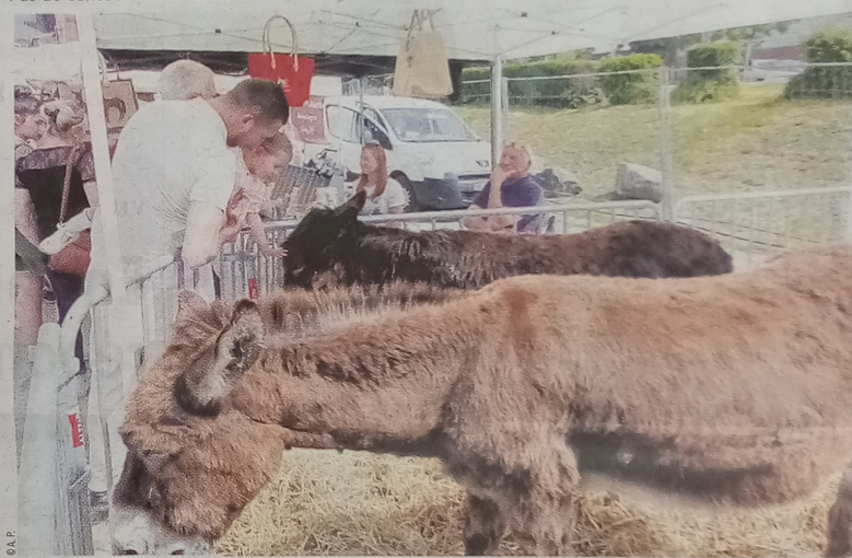
Les ânes de l'asinerie du Marquenterre étaient les stars des enfants.